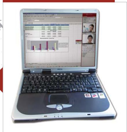
Widok klienta: Klient wyświetla okno jakiejś aplikacji.