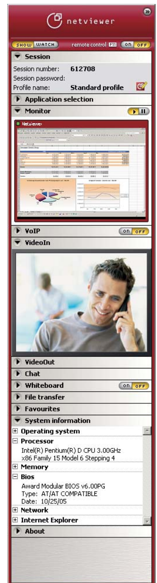
Panel kontrolny programu Netviewer: I masz wszystko pod ręką.