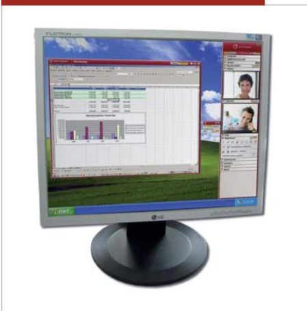
Widok konsultanta: Oto okno aplikacji klienta widoczne na ekranie Moderadora.